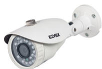
46CAM.136B.8 - Kam.Bullet IR AHD 1080p Obj. 3,6mm CVBS