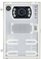
41007 - SIP-Einheit A/V Teleloop Weitwinkel