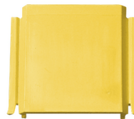
V70191 - Verbindungsstück f. Abzweigdose gelb