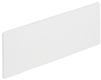
V70109 - Hochbeständige Abdeckung f. V70009