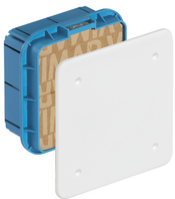
V70001 - UP-Abzweigdose 92x92x50mm