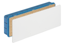
V70009 - UP-Abzweigdose 479x154x70mm