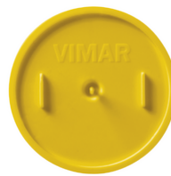
V71011 - Mörtelschutzdeckel f. Dose ø60mm gelb