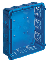
V71321 - Unterputzdose 18/21M hellblau