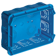
V71320 - Unterputzdose 12/14M hellblau