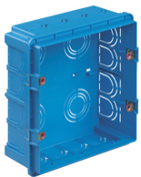
V71318 - Unterputzdose 8M hellblau