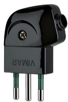
00211 - Φίς αρσενικό 2P+E 10A S11 90° μαύρο