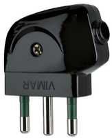
00212 - Φίς αρσενικό 2P+E 10A S17 90° μαύρο