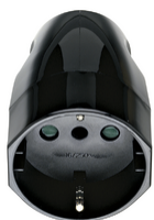
00224 - Φίς θηλυκό 2P+E 16A P30 ευθείας μα