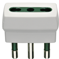
00300.B - Αντάπτορας S17 με έξοδο P17/11 λευ