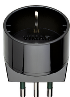
00302 - Αντάπτορας S11 με έξοδο P30 μαύρος