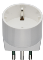
00302.B - Αντάπτορας S11 με έξοδο P30 λευκ