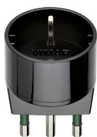
00303 - Αντάπτορας S17 με έξοδο P30 μαύρ