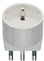
00303.B - Αντάπτορας S17 με έξοδο P30 λευκ