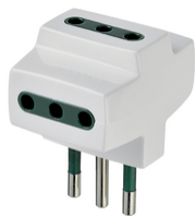
00320.B - Αντάπτορας S11 με 3 εξόδους P11 λ