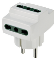
00324.B - Αντάπτορας S31+3 εξόδ. P17/11 λευκό