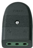
01023 - Φίς θηλ. 2P+E 10A P11 ευθείας μαύρο