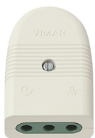
01023.B - Φίς θηλ. 2P+E 10A P11 ευθείας λευκό