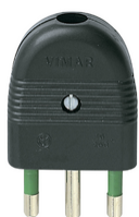
01026 - Φίς αρσενικό 2P+E 16A ευθείας μα