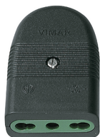
01029 - Φίς θηλ.2P+E 16A P17/11 ευθείας μαύρ