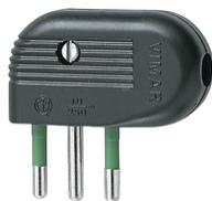
01041 - Φίς αρσενικό 2P+E 10A πλαγίας μα