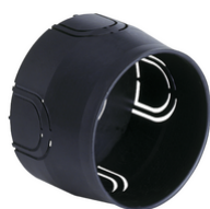
V71001.AU - Κουτί στρογγυλό χωνευτό \varnothing 60\text{mm} μ