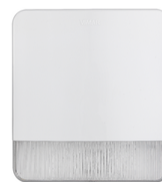
03827 - By-alarm Plus σειρήνα εξωτερ.χώρου