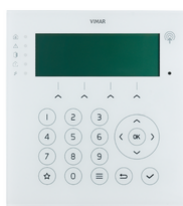
03818 - By-alarm Plus πληκτρολόγιο οθόνη+αναμετ