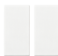
14506 - Κουμπί 1M για εντολή RF λευκό - 2Τεμάχια