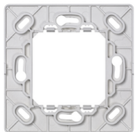
14507 - Βάση στήριξης διακόπτη ραδιοσυχν 2M λευ.