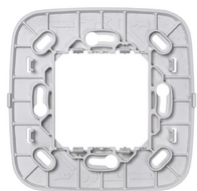
19507.RN.B - Πλαίσιο συσκευή RF Round πλάκα λευκό