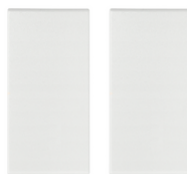
19506.B - Κουμπί 1M για εντολή RF λευκό - 2Τεμάχια