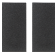
19506 - Κουμπί 1M για εντολή RF γκρί - 2Τεμάχια