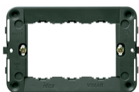
16713 - Βάση στήριξης 3M + βίδες