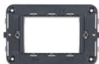
16723 - Βάση στήριξης 3M Arké idea+βίδες, γκρί