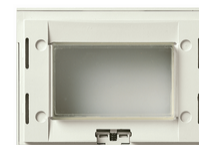
16813.Q.B - Βάση στήριξης IP55 3M λευκό