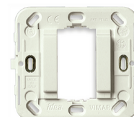
17086.B - Βάση στήριξης 1M μειωμ. d.60/56x56mm