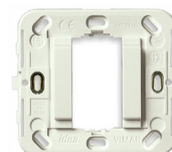
17086.B - Βάση στήριξης 1Μμειωμ.d.60/56x56mm