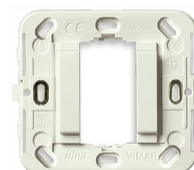
17086.B - Βάση στήριξης 1Μμειωμ.d.60/56x56mm