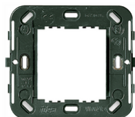
17087 - Βάση στήριξης 2Μμειωμ. d.60/56x56mm