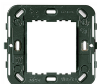
17087 - Βάση στήριξης 2Μμειωμ. d.60/56x56mm