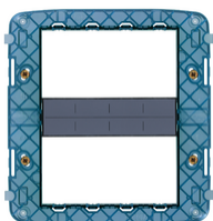
19618 - Βάση στήριξης 8M με βίδες