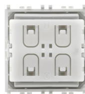
03925 - Συσκευή RF Bluetooth Low Energy