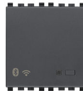
20597 - είσοδος πυλών IoT 2M γκρι