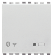
20597.N - είσοδος πυλών IoT 2M Next