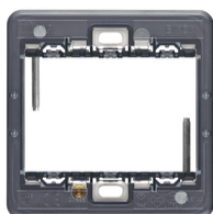
20608 - Βάση στήριξης 3M BS