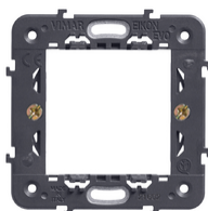
21602 - Βάση στήριξης 2M με άγγιστρα 71mm