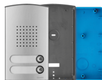
40142 - 2-family audio entrance panel