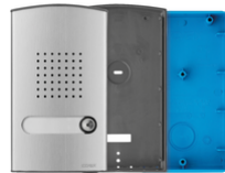
40141 - 1-family audio entrance panel