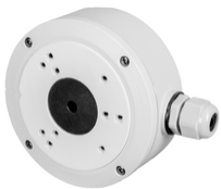
46922.040 - Στήριγμα για IP κάμερα