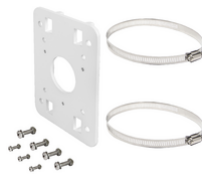
46917.005 - Βάση ορθοστάτη κάμερες IP