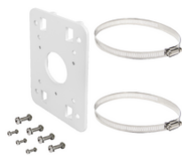
46917.005 - Βάση ορθοστάτη κάμερες IP