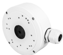
46922.041 - Στήριγμα για IP κάμερα