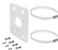
46917.005 - Βάση ορθοστάτη κάμερες IP