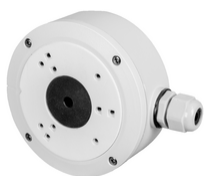
46922.040 - Στήριγμα για IP κάμερα