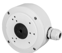
46922.040 - Στήριγμα για IP κάμερα