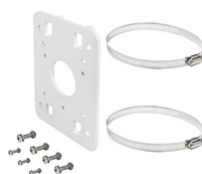
46917.005 - Βάση ορθοστάτη κάμερες IP