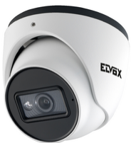
4622.028FSA - Κάμερα Dome IP 8Μpx 2,8mm Mic A.V.