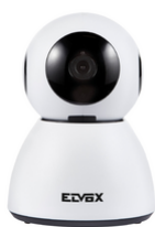
46239.040A - Κάμερα PT Wi- Fi Full-HD 1080p 4mm