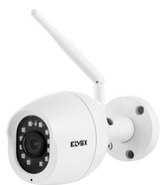
46237.040A - Κάμερα Bullet Wi-Fi Full-HD 1080p 4mm