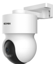
46241.030B - Κάμερα Wi-Fi PT 1080p - 3mm υπαίθριος