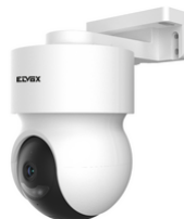
46241.030B - Κάμερα Wi-Fi PT 1080p - 3mm υπαίθριος