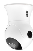
46241.036A - Εξωτερική κάμερα PT Wi-Fi Full-HD-3,6mm