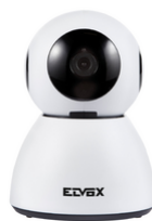
46239.040A - Κάμερα PT Wi-Fi Full-HD 1080p 4mm