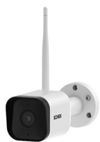
46242.036C - Πρόσθετη κάμερα για κιτ 46KIT.036C