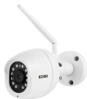
46237.040A - Κάμερα Bullet Wi-Fi Full-HD 1080p 4mm