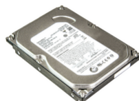
46925.030 - Επαγγελματικός HDD SATA3,5in 3TB για DVR