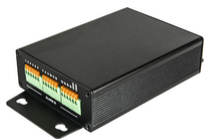
46936.001 - USB alarm extension