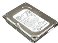
46925.030 - Επαγγελματικός HDD SATA3,5in 3TB για DVR