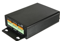
46936.001 - USB alarm extension